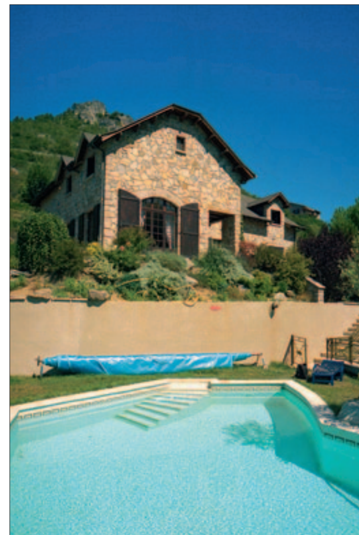
Le Rozier, à l'entrée des Gorges du Tarn